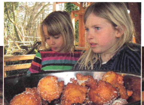
Fotos unten: Impressionen von den Aktionstagen auf dem Kinderabenteuerverhof